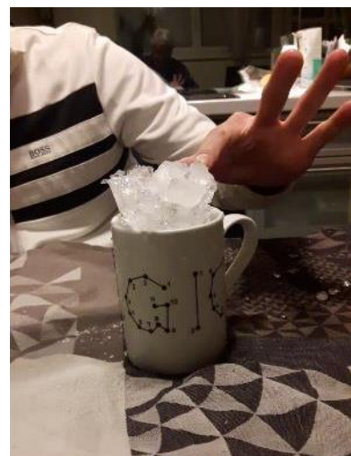
Photos de la réunion de la section du jeudi soir à Nancy sur le thème « ça glisse »