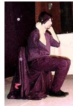
congrès de Dunkerque.