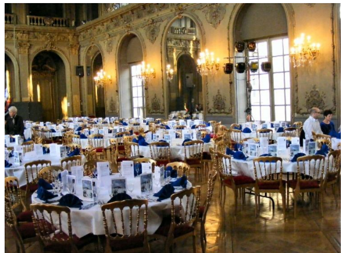
La salle de spectacle

J'y ai rajouté quelques effets automatiques (verres, bougie) et quelques effets personnels (carte, balle que j'ai oublié de faire, verre en bouteille sur feuille de journal avec production d'une bouteille, plusieurs manipulations de cartes géantes également).