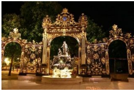
Les portes d'or, Place Stanislas à Nancy

Cette soirée était pour moi l'occasion de me présenter pour la première fois à un concours d'une part et de rencontrer des passionnés d'autre part.