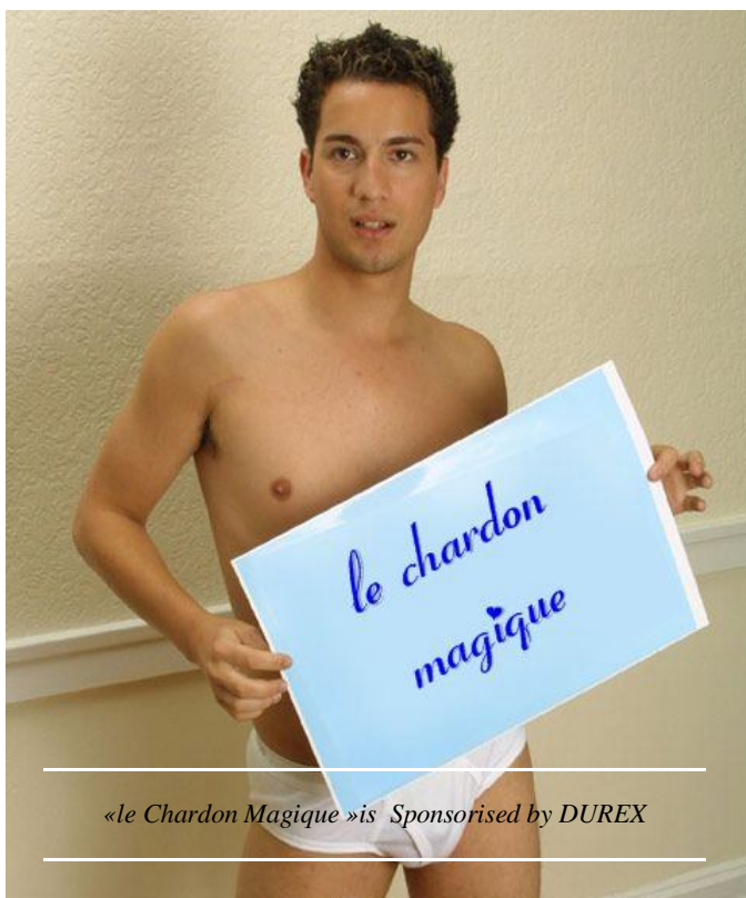
«le Chardon Magique » is Sponsored by DUREX