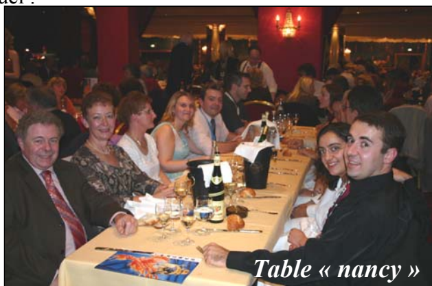
Table « nancy »

Chacune de ses danses est alternée avec un numéro visuel :