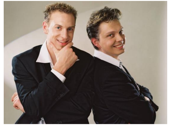
Stonkel - Allemagne

Luis – Sandy – Yannick – Xavier : Close-up - FRANCE